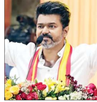
सीपीआईएम ने भी सदन में टीवीके सरकार के पक्ष में खड़े होने की बात कही।

चेन्नई। तमिलनाडु की टीवीके सरकार ने विधानसभा में बहुमत साबित कर दिया है। बुधवार को हुए विश्वास मत में मुख्यमंत्री विजय के नेतृत्व वाली सरकार को 144 विधायकों का समर्थन मिला। 234 सदस्यीय सदन में 22 विधायकों ने सरकार के खिलाफ मतदान किया, जबकि पांच सदस्य वोटिंग में शामिल नहीं हुए। फ्लोर टेस्ट के दौरान कई विपक्षी और सहयोगी दलों ने खुलकर टीवीके सरकार को समर्थन देने का एलान किया। कांग्रेस ने विधानसभा में विश्वास मत के दौरान विजय सरकार का समर्थन करने की घोषणा की। वहीं